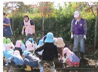
隣接する保育園や地域の方と一緒に