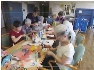
手芸や工作などを行い、作品展を開催します