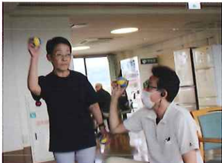
自分の好きな時間を楽しんで頂きます