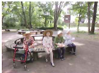
入居者様の希望で余暇活動や外出支援を行います