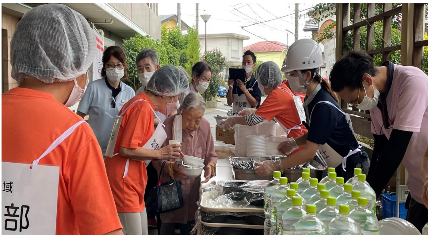
地域応援協定に基づく防災訓練の「炊き出し訓練」